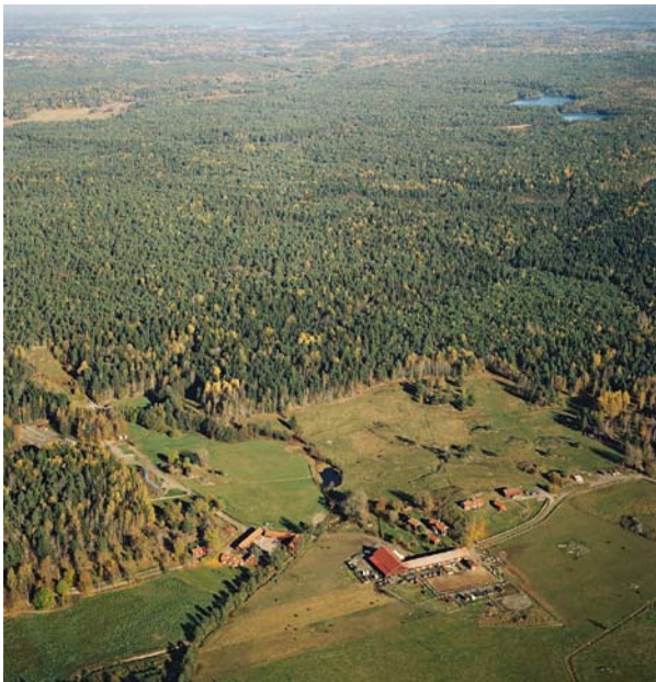
Tyresta nationalpark, ett av områdena i länet där du kan geocacha.