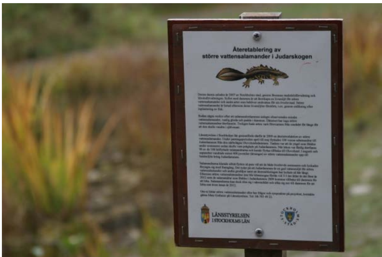
Fig 1 En av de två informationsskyltarna om återintroduktionen vid Judardammen.

Två informationsskyltar om återintroduktionen togs fram och sattes upp vid Judardammen i mars 2010. Skyltarna har klarat sig utan skadegörelse eller annan åverkan.