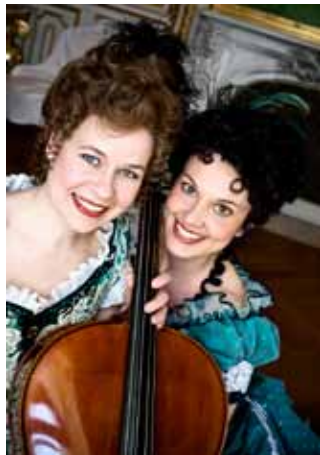
På Ljusterö arbetar just nu sångare och musiker tillsammans med öns företagarförening för att utveckla samhället.

Jussi Björling, den internationellt mycket uppskattade tenoren, hade sitt sommarhus på Sjarö, och där somnade han in den 9 september 1960. Han brukade hålla välgörenhetskonserter på Ljusterö och fylla den vita skärgårdskyrkan till sista platsen. Enligt hörsången öppnades fönstren så att de som trängdes på de välkrattade grusgångarna utanför också skulle höra.