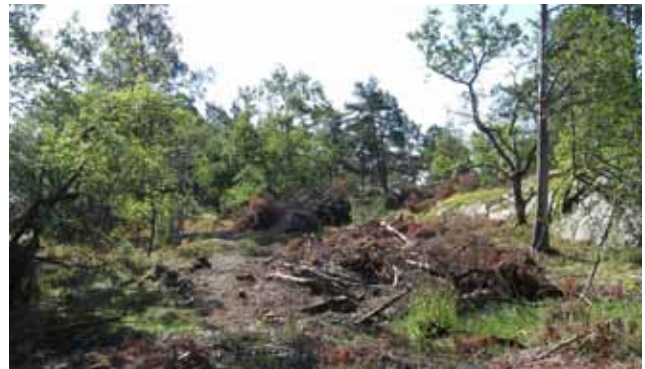
Mosaikbete under restaurering. Här har jämnårig tall fått lämna företräde för tidigare trängda lövträd och ljusnedsläpp till markfloran.