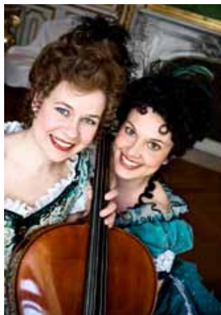
På Ljusterö arbetar just nu sångare och musiker tillsammans med öns företagarförening för att utveckla samhället.

Jussi Björling, den internationellt mycket uppskattade tenoren, hade sitt sommarhus på Sjarö, och där somnade han in den 9 september 1960. Han brukade hålla välgörenhetskonserter på Ljusterö och fylla den vita skärgårdskyrkan till sista platsen. Enligt hörsången öppnades fönstren så att de som trängdes på de välkrattade grusgångarna utanför också skulle höra.