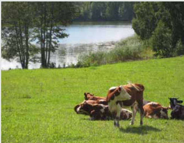
Betesdjur vid sjön Sparren.