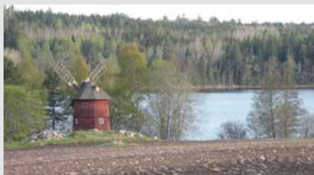
Sjön Sparren.

Enskilda avlopp svarar för 1/8 av fosfor och 1/20 av kvävet, dagvattnet (som till största delen kommer från Åkersberga) 4% av fosfor och nästan 2% av kvävet.