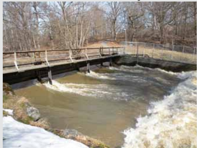
Slussen i Åkersberga

Mer fakta om Åkerströmmens avrinningsområde hittar du på Länsstyrelsens webbplats om miljömål, www.lansstyrelsen.se/stockholm/