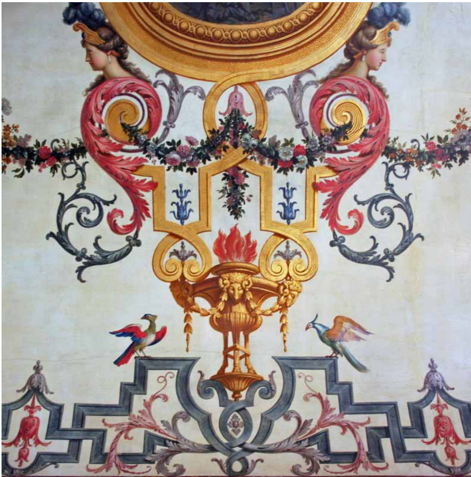
Detalj ur takmålning i paradvåningen bevarad från Tessins tid.