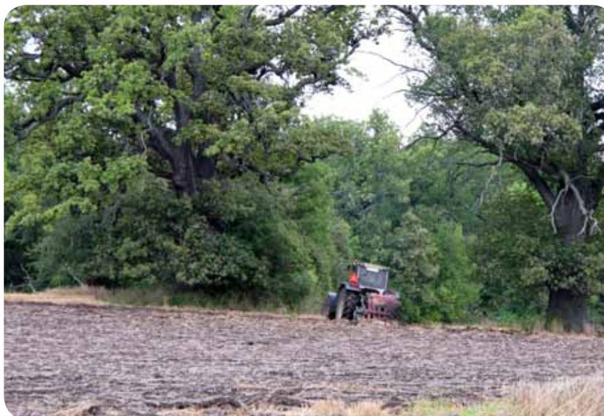
Höstplöjning på Kärsö.