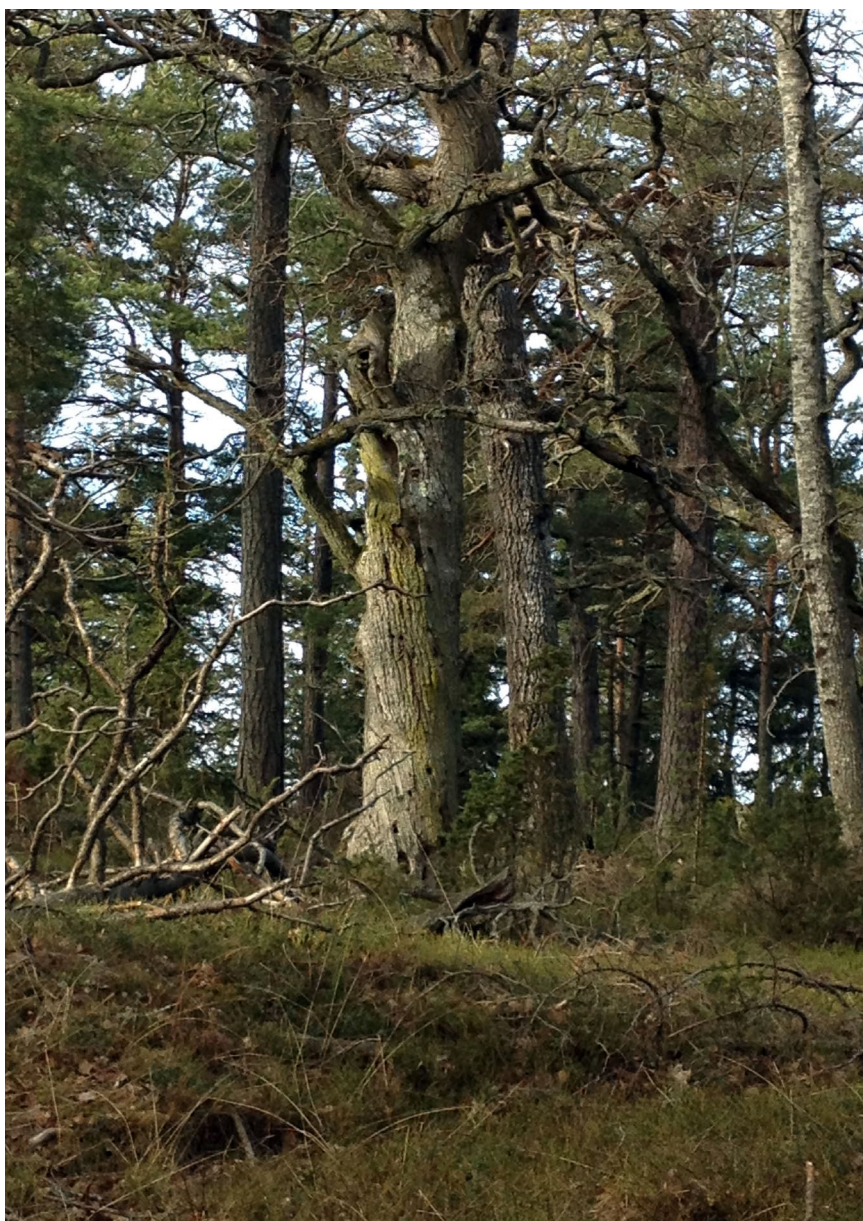
Ekrika blandskogar är typiska för Stockholms län

“ Det är genom frivilliga initiativ vi får de bästa förutsättningarna att långsiktigt skapa bra naturvärden i skogen