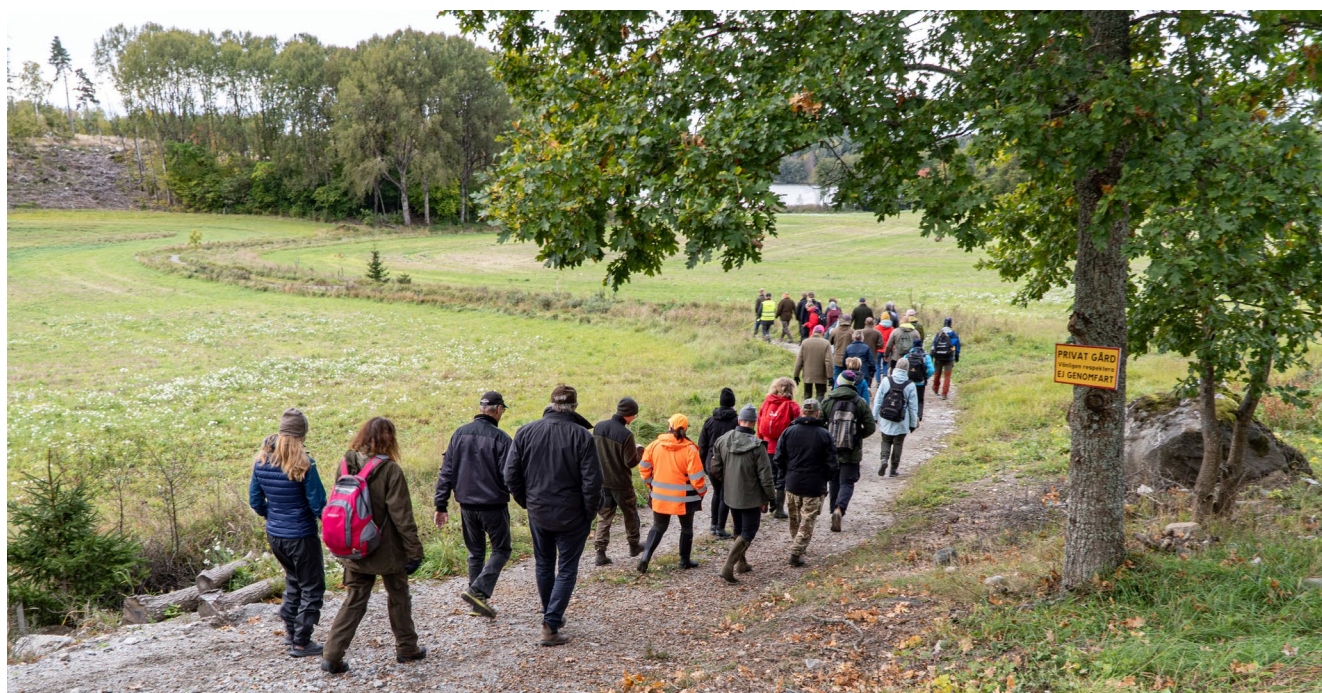
Styrgruppen för Stockholms läns skogsstrategi träffades på Billby gård.

– Enskilda personer eller ett fåtal som vill vandra i naturen, plocka lite bär eller svamp, är inget problem. Tvärtom, jag välkomnar dem. Men när det blir flera hundra som vistas på en liten yta och dessutom hugger ner träd och buskage, då blir det ett problem,