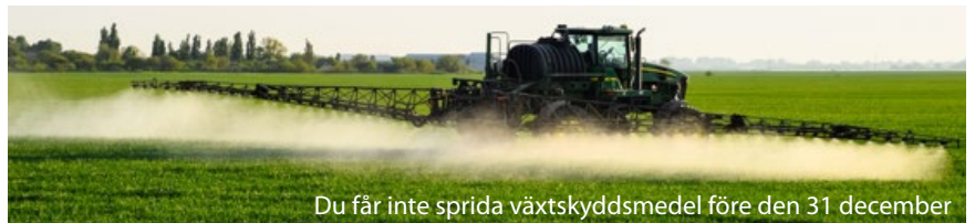
Du får inte sprida växtskyddsmedel före den 31 december

Förbudet mot att använda växtskyddsmedel i ersättningen för vårbearbetning som fanns innan 2023 är tillbaka i liknande form. Du får inte sprida växtskyddsmedel som avdödar växtlighet på marken förrän efter den 31 december. ■