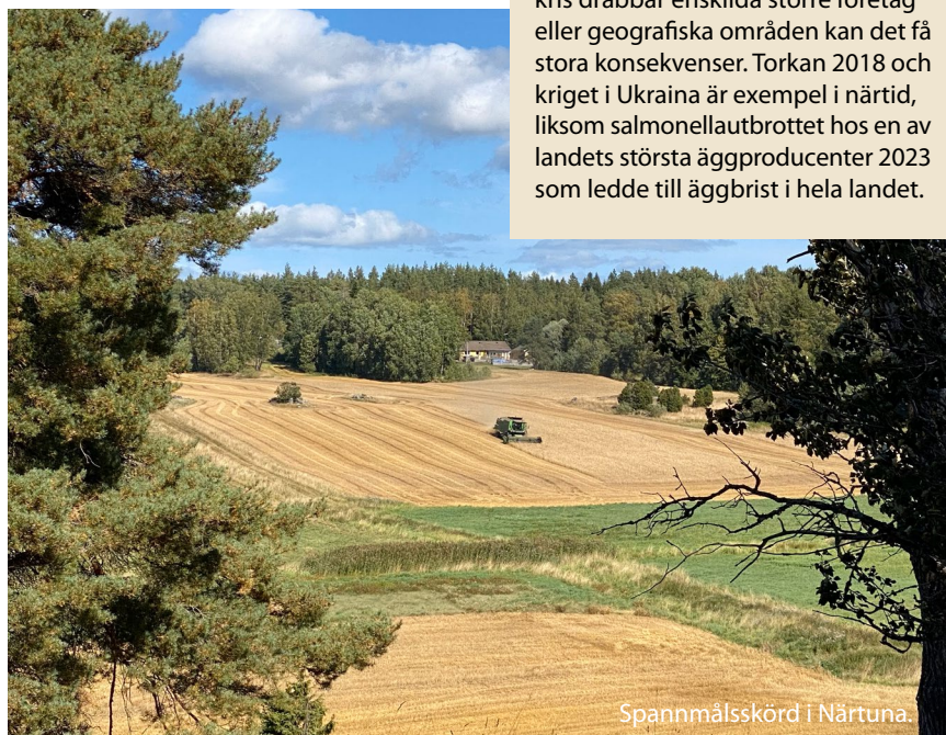
Spannmålskörd i Närtuna.

Att livsmedelsföretagen blir färre och större bidrar till att öka sårbarheten i livsmedelskedjan. Om en kris drabbar enskilda större företag eller geografiska områden kan det få stora konsekvenser. Torkan 2018 och kriget i Ukraina är exempel i närtid, liksom salmonellautbrottet hos en av landets största äggproducenter 2023 som ledde till äggbrist i hela landet.