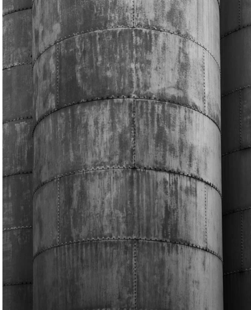
Kvarnholmen Nacka.