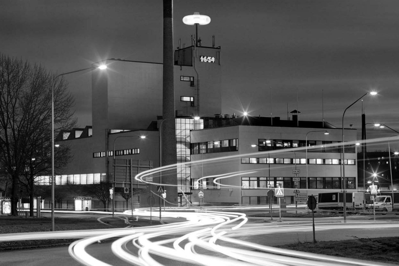
San Remobageriet i Västberga.