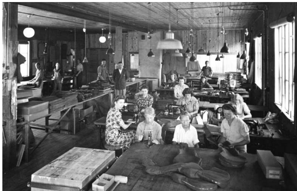
Järna reseffektfabrik.

Ett handlingsprogram har byggts upp kring flera projekt vilka oftast koncentreras på en anläggning och en frågeställning som belyser något väsentligt i länets industrihistoria. Projekten ska ge ny kunskap om länets industriella arv och diskutera lämpliga metoder för att arbeta med det industriella kulturarvet. De miljöer som vi arbetar med ska vara angelägna för