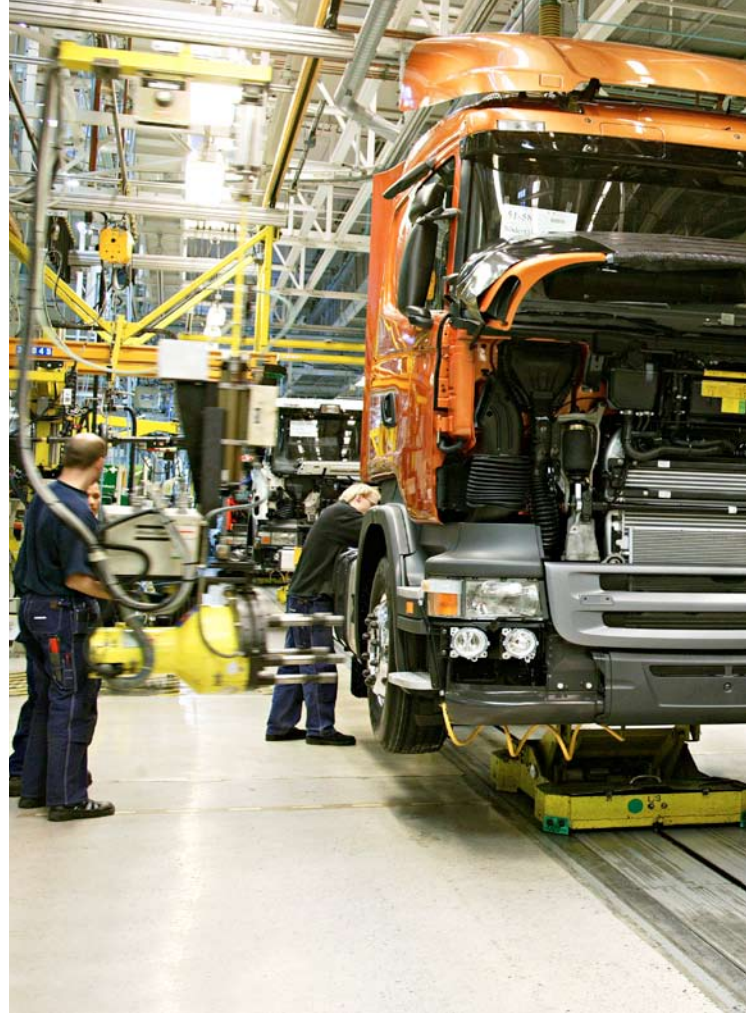
Scania i Södertälje.

industrierna och de stora industriområdena samt de många småföretagen bär på historierna om det som alldeles nyss var vår samtid.