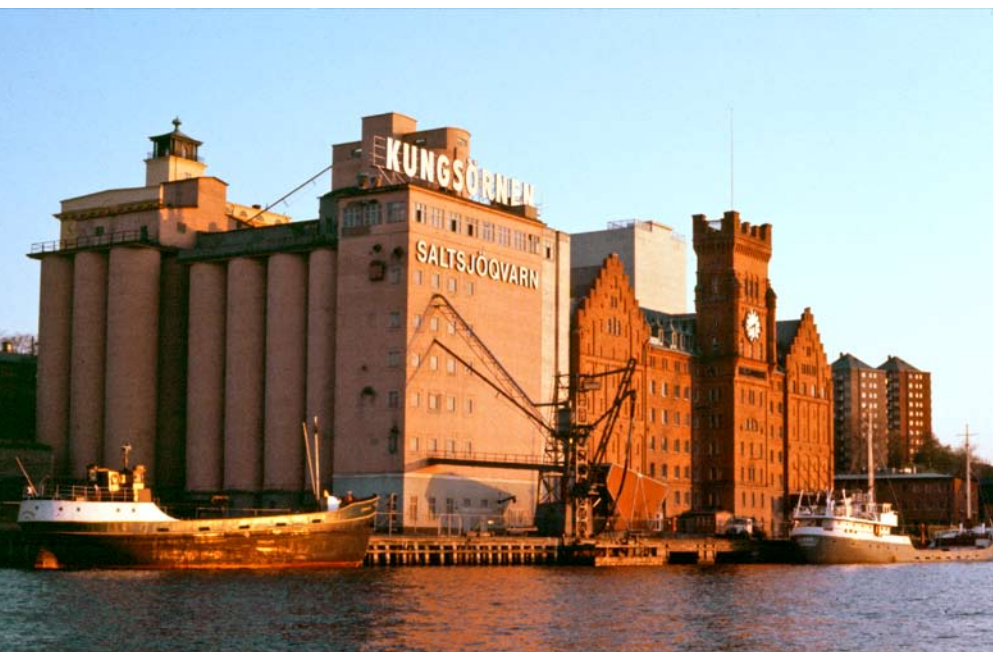
Saltsjövarn. Foto: Gunnar Sillén, 1980, Stockholms läns museum.

Många industriområden har under senare år omvandlats till bostadsområden där endast delar av de industriella anläggningarna har bevarats och getts ett nytt innehåll. Järla sjö, Hammarby sjöstad och Lilla Essingen är några exempel. Länsstyrelsen vill att industriarvet ska vara en tillgång i de nya stadsdelarna och påminna om platsernas industrihistoriska betydelse.