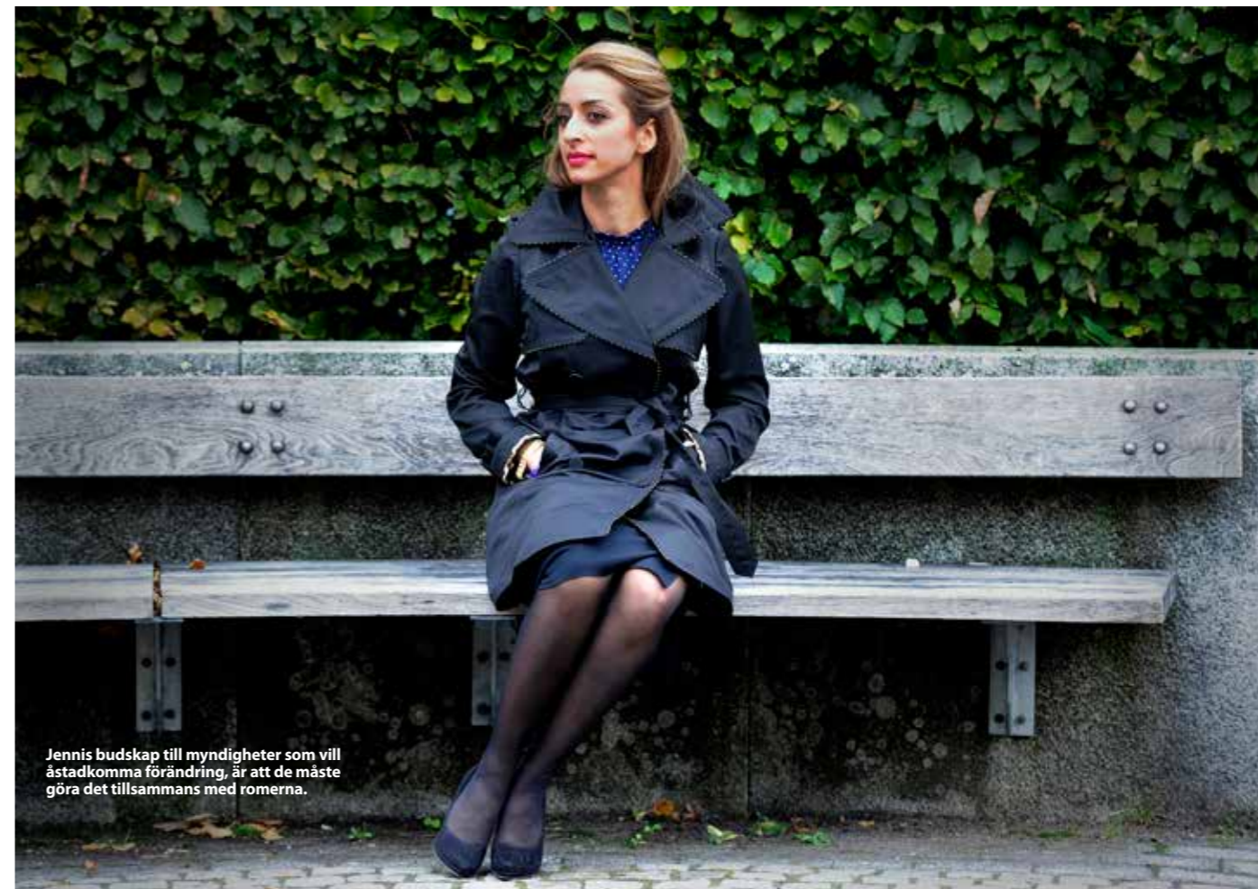
Jennis budskap till myndigheter som vill åstadkomma förändring, är att de måste göra det tillsammans med romerna.

”Man kanske kunde ordna så att det är något häftigt som drar”, fortsätter hon. ”En artist som kan locka unga. Man kan arbeta med sociala medier, appar, Instagram. Det är ett sätt att nå de unga. Facebook är mer för de äldre. Rappare kan också vara förebilder, många unga håller på med musik.”