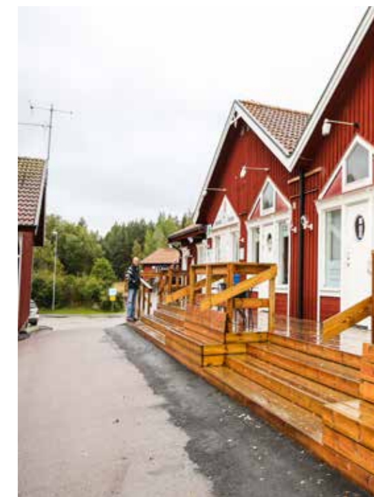
Ljusterö torg

bli första bygderna inom projektet. Utvecklingen med Covid-19 påverkar givetvis planeringen men förhoppningen är att kunna arrangera de första träffarna till hösten. ■