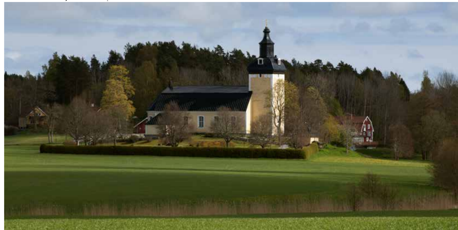
Hölö kyrka