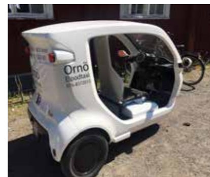
Ornö Turism- och eltaxikooperativs elpodtaxi.

– Vi kan även se att visionsarbetet i sig har bidragit till ökat samarbete inom de tre huvudområdena vilket känns lovande för framtiden, fortsätter han. ■