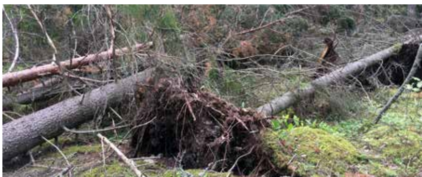
Länsstyrelsen uppmanar reservatsbesökare till stor försiktighet när man rör sig ute i skog och mark. Det kan fortfarande finnas enstaka hängande och farliga träd.

...om barkborrar och våra åtgärder på Länsstyrelsens webbplats .