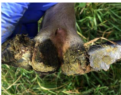
Senare stadie av CODD.

Du som har skog och mark kan ladda ner och skriva ut en gratis informationsaffisch om Afrikansk