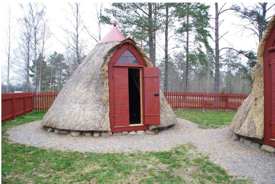
Bild 7. Halmhyddorna användes under Kungl. Kronobergs regementes övningar på Kronobergshed. Totalt byggdes 137 stycken under tiden 1841–1889. De två byggnadsminnesskyddade hyddorna flyttades 2020 till en ny placering inom heden.

Länsstyrelsen i Kronoberg har sedan 2014 vid tryck av digitalt informationsmaterial ställt krav på att materialet görs tillgängligt för hjälpmedelsanvändare. Sedan 2020 tillämpas också tillgänglighetskraven i lagen om tillgänglighet till digital offentlig service hos alla offentliga myndigheter och aktörer.