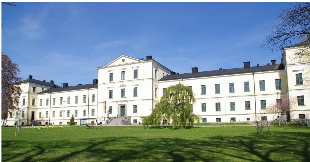
Bild 8. Den stora hospitalsbyggnaden inom byggnadsminnet St. Sigfrid uppfördes 1855–57 och fungerade som vårdinrättning fram till 1990-talet. Byggnaden kallas populärt för Italienska palatset.

Byggnadsminnesstrategin utgår från de nationella kulturmiljömålen och målbilderna i länets kulturmiljöstrategi, som i stor del syftar till att bredda perspektiven med en mångfald av kulturmiljöer som speglar hela samhällets utveckling.