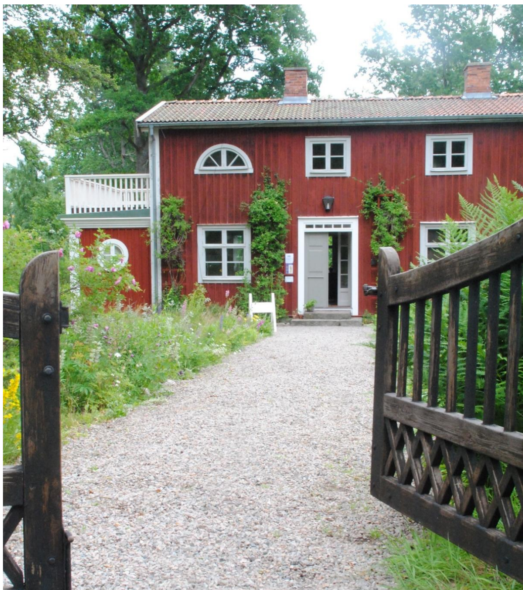
Bild 3. Byggnadsminnet Elin Wägners lilla Björka i Bergs socken. Elin Wägner lät bygga bostaden år 1924, efter ritningar av arkitekten Carl Bergsten.

Länsstyrelsen får inrätta ett byggnadsminne om de kulturhistoriska värdena är tillräckliga. Länsstyrelsen kan därmed själv göra en bedömning i varje enskilt ärende om det är lämpligt att utreda en fråga vidare. Ägarens inställning till en byggnadsminnesförklaring har stor betydelse. Ett aktivt intresse från ägare och samverkan mellan fastighetsägaren och Länsstyrelsen skapar förutsättningar för en långsiktig förvaltning. Länsstyrelsens arbete med att få en heltäckande bild av länets bebyggelseutveckling kan försvåras av att byggnader väljs bort, inte på grund av dess kulturhistoriska värden, utan framtida förvaltningsmöjligheter, ekonomiska resurser etc.