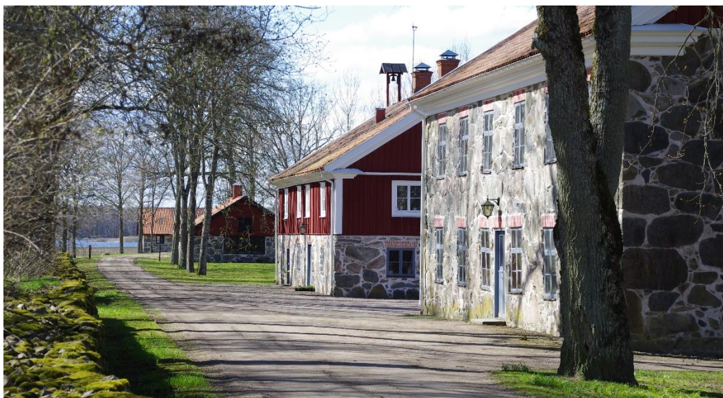
Bild 4. Bygatan vid Lidhems säteri i Tingsryds kommun.

Strategin hanterar inte heller riktlinjer för tillsyn och handläggning av redan befintliga byggnadsminnen, med undantag för ovanstående genomgång.