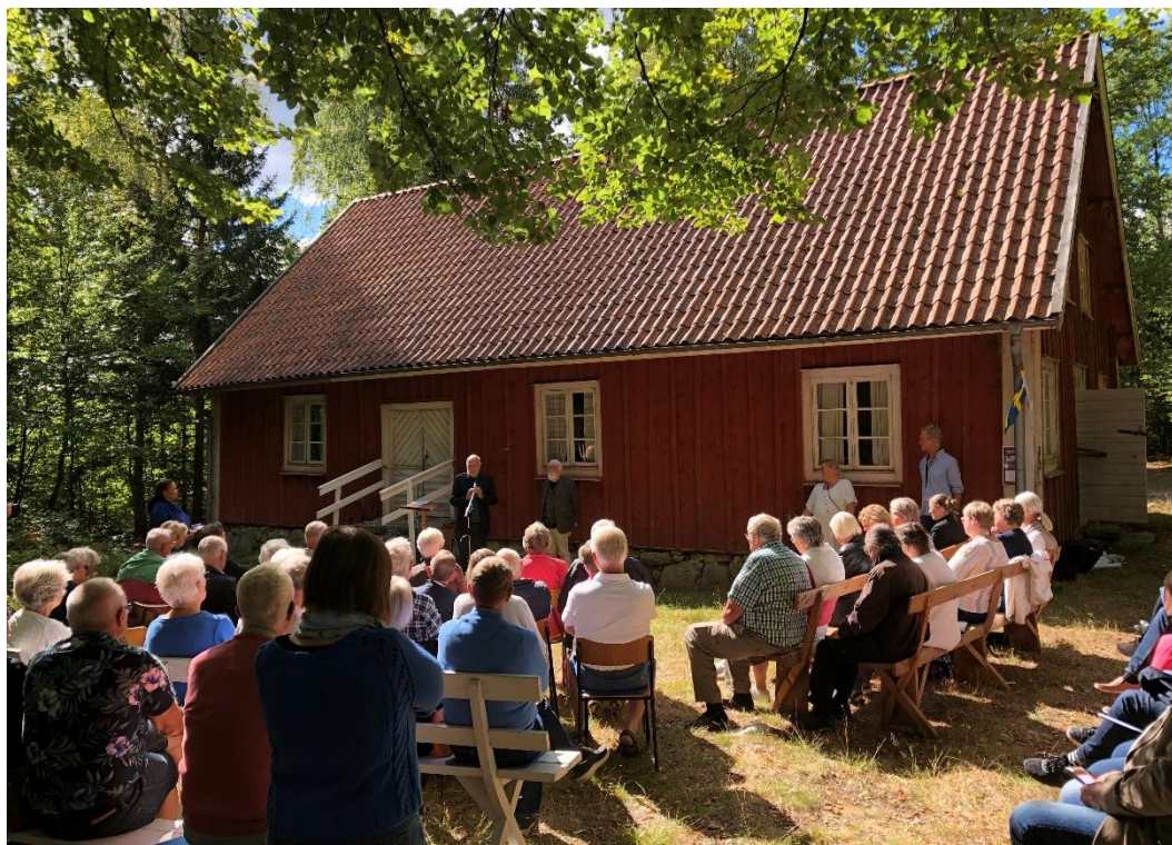
Bild 2. Invigningen av Iссjöa missionshus som byggnadsminne år 2022. Invigningen lockade ett hundratal besökare.

Genom regeringens proposition om kulturmiljövård 1987 fördes begreppet kulturmiljö in i lagtexten. I propositionen poängterades även vikten av att se till vardagsmiljöer och att på ett allsidigt sätt bevara kulturmiljöer som speglar vår historia. Ett resonemang fördes även kring tidsaspekten och möjligheten att förklara yngre bebyggelse som byggnadsminne.