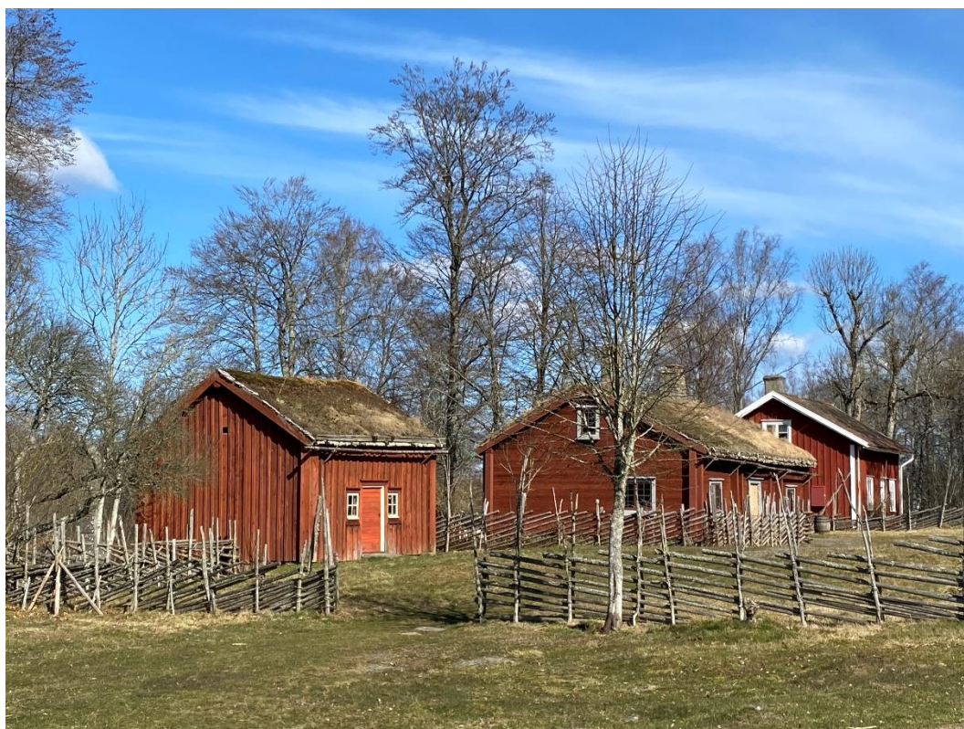
Bild 1. Kulturreseptatet komministerbostället i Råshult, där Linnéstugan i mitten är skyddad som byggnadsminne.

Byggnadsminnesstrategin är tänkt att fungera som ett instrument för Länsstyrelsen i prioriteringar och urval av nya byggnadsminnen. Detta innebär att Länsstyrelsen i sin handläggning av ett ärende om byggnadsminnesförklaring kan göra bedömningar även mot andra aspekter än de som rör det kulturhistoriska värdet. Exempelvis att en viss miljö är överrepresenterad. Handlingsplanen redovisar prioriteringar och för hur och när arbetet ska genomföras.