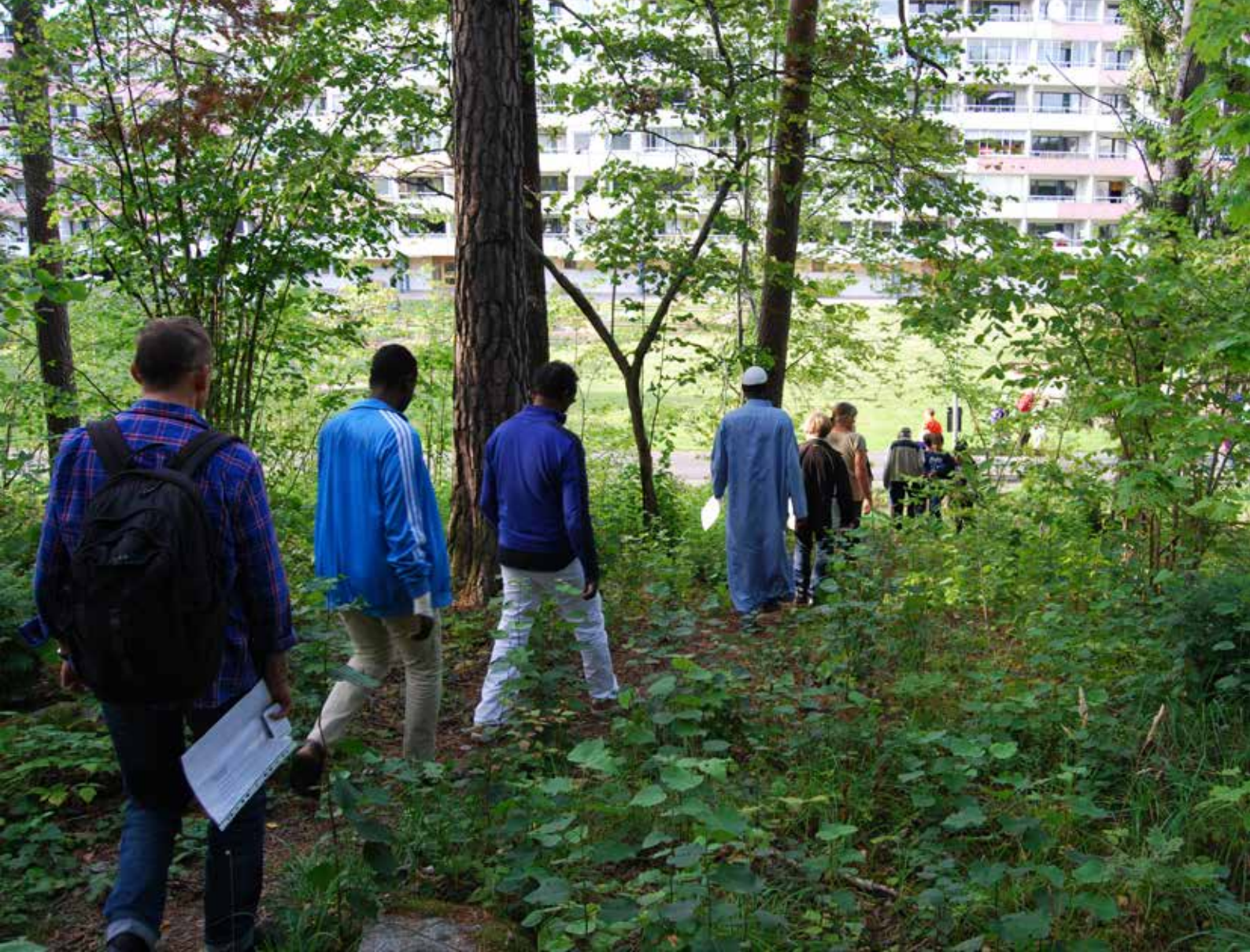
Fortidsvandring genom Brandkärr i Nyköping.